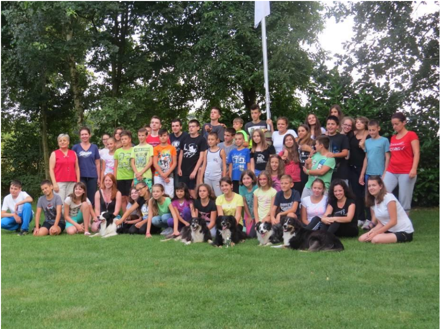
Groepsfoto kamp 2016