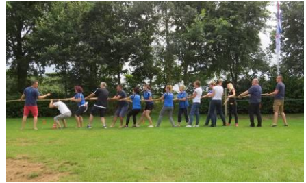
sport en spel