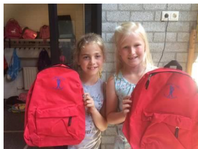
Rugzakken van "Het Startblok"

Bij aankomst krijgen de kinderen deze kaartjes maar ook een mooie rugzak.