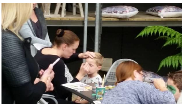
Schminken tijdens evenementen

In de wintermaanden worden de voorbereidingen getroffen voor het bezoek dat in april moet plaatsvinden. We maken dan alvast de kampboekjes die in het voorjaar bij de scholen worden afgegeven. De kinderen krijgen ze een paar weken voor de reis begint.