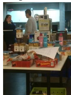
Maandelijks BINGO met veel prijzen

Één keer in de maand hebben we in Naaldwijk in het Atrium bij de Ontmoetingskerk een bingo avond. Iedereen is daar van harte welkom en de opbrengst is uiteraard voor de SVSK. Gelukkig houden we daar iedere keer weer een leuk bedrag aan over maar onze bingo-ers denken ook met ons mee. We hebben iedere bingo avond een koffie ronde en er