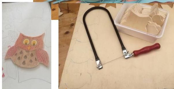
Knutsel en plakboekvoorbereidingen

Er worden diploma's gemaakt maar er moeten ook bekens en medailles gekocht worden. We trekken er soms dagen op uit om alles in orde te krijgen. Er worden afspraken gemaakt voor het laden, lossen en opbouwen van het zomerkamp: wanneer gaan we laden, wanneer naar de Zandkamp, op vrijdagavond of zaterdagochtend, wie helpen er met het inladen, het opbouwen?