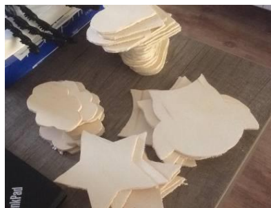
Labels voor de rugzakken

Deze rugzak is een cadeau van de kinderen van groep vier van de school Het Startblok in Honselersdijk. Aan de rugzak komt een hartje (meisjes), een ster (jongens) of een wolk (leiding) waar ieder zijn naam op kan zetten.