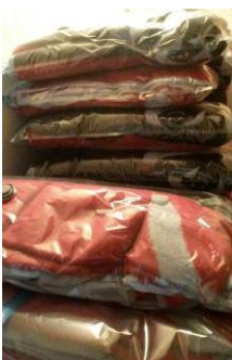
Wassen en opslag van de dekens

Het begint eigenlijk gelijk al na het kamp 2016. De eerste dagen doen we niet zo veel, we moeten even bij komen van het kamp en onze gewone werkzaamheden beginnen ook weer en onze koffers en dozen en tassen moeten uitgepakt worden en we moeten kijken wat we nog wel en wat we niet meer hebben.