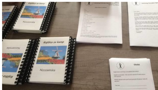
Kampboekjes en lijsten klaar voor gebruik